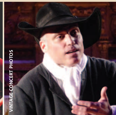
VINTAGE CONCERT PHOTOS