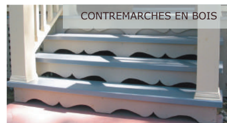
CONTREMARCHES EN BOIS