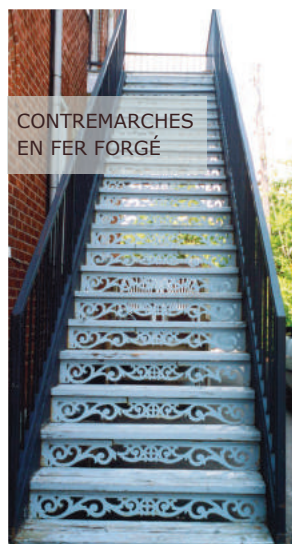
CONTREMARCHES EN FER FORGÉ