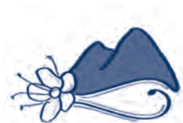
Corporation Municipale de la Paroisse de Saint-Urbain